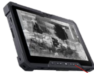
Kumanda Kontrol Birimi