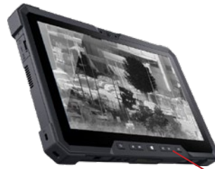
Kumanda Kontrol Birimi